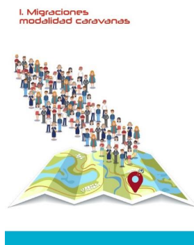
Creación Propia Región LAC Acciones Contrahegemónicas de Movilidad (S. XXI)