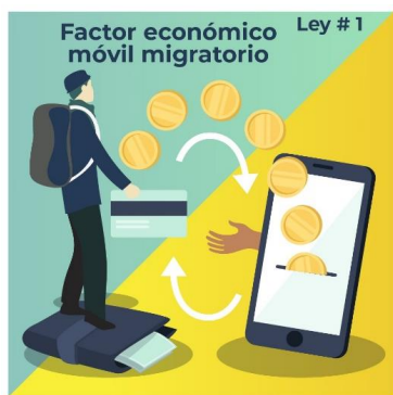
Adaptación propia Leyes de Ravenstein 20 (S. XIX)

Se tiene como las opciones y expectativas que mantienen un crecimiento social, sin duda es la alta cualificación de las poblaciones, y si ello, se logra sin costo previo es una gran ventaja frente al trato y acogida “justa de los movimientos migratorios”, puesto que si partimos de una diversidad humana, no por ello, el trato y la fijación de políticas migratorias que se relacionan desde los Estados de origen/transito/destino, su tratamiento es disímil, extremista y unilateral, por ello, las poblaciones que toman la “movilidad migratoria” como una alternativa de vida y cambio, sin importar su situación irregular, son una fuente vital para las sociedades de destino, aspectos que entre los S. XIX-XX no se tuvo tal mirada y los flujos fueron solo como fuerza de trabajo (Imagen 1), en el ahora (2023) pasadas dos décadas del S.XXI, (Imagen 2) los escenarios son de otro nivel.