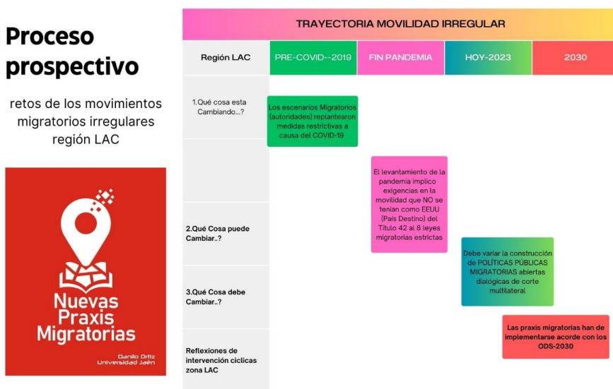
Diseño propio Implementación Prospectiva Migraciones LAC

En consecuencia tenemos como el uso e implementación de las ideas, métodos de prospectiva (Godet) y los desarrollados desde las entidades regionales oficiales como la CEPAL 22 reflejan cuan relevante es tener una pluralidad de participaciones en estudios que puedan proponer cambios con proyecciones a largo plazo, lo cual es más complejo en trabajos doctorales dado que se hacen de manera particular en